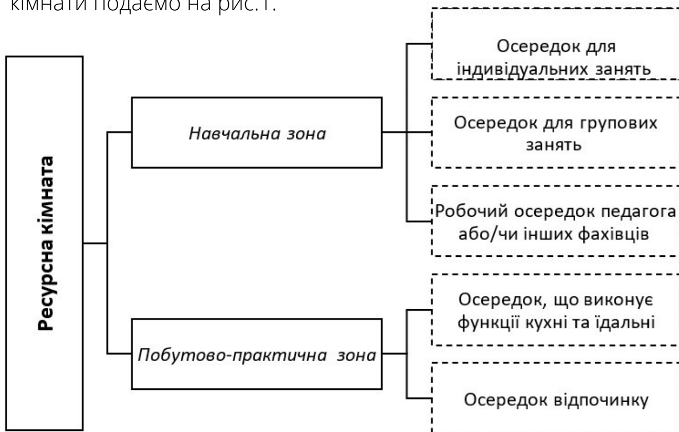
Рис. 1. Орієнтовне проєктування основних складових ресурсної кімнати

Орієнтовне проєктування основних складових ресурсної кімнати подаємо на рис.1.