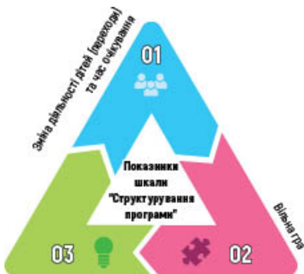
Загальногрупова діяльність: гра та навчання

Перехід від одного виду діяльності дітей до іншого має відбуватися поступово чи індивідуалізовано (наприклад, частина групи може вийти надвір, доки інші малята ще одягаються; дітям дозволено розпочати їсти, щойно вони сядуть за столи; педагог може розпочати ранкову зустріч, хоча дехто з вихованців ще не закінчив перевдягатися). Коли зміна діяльності здійснюється плавно та швидко, дітям майже не доводиться чекати, нічого не роблячи. Зазначимо, що відповідно до вимог методики ECERS-3 тривалість очікування дітей під час переходу від одного виду діяльності до іншого не повинна перевищувати 3 хвилини.